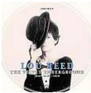
Les livres des éditions du Layeur ont les mensurations "vinyle".

En comparaison, le "Cover" que Belkacem Bahlouli consacre à Bruce Springsteen ressemble à cette highway que fréquentent tant de héros de ses chansons ! La production du boss étant moins pléthorique, et moins foutraque que celle des susmentionnés, le journaliste de Rolling